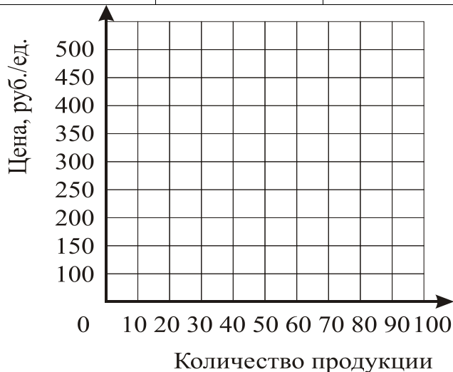
Рисунок 2 - Кривая отраслевого предложения