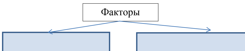
Рис.1. Факторы развития финансового инжиниринга

Решение: отобразите схематично структуру факторов.