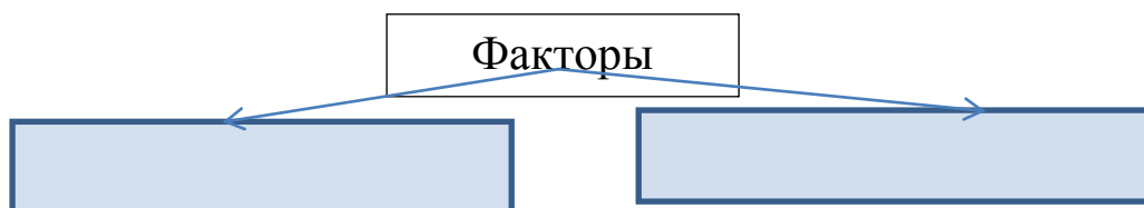
Рис.1. Факторы развития финансового инжиниринга

Решение: отобразите схематично структуру факторов.