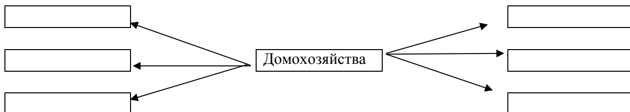
Схема 2. Внешние финансовые отношения

Задание 2. Перечислите внешние финансовые отношения домохозяйств. Отрадите это в схеме 2. Определите роль домохозяйства в системе финансовых отношений.