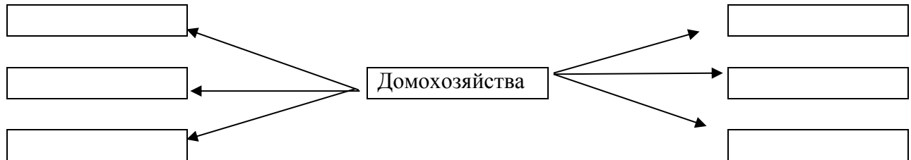
Схема 2. Внешние финансовые отношения

Задание 2. Перечислите внешние финансовые отношения домохозяйств. Отражите это в схеме 2. Определите роль домохозяйства в системе финансовых отношений.